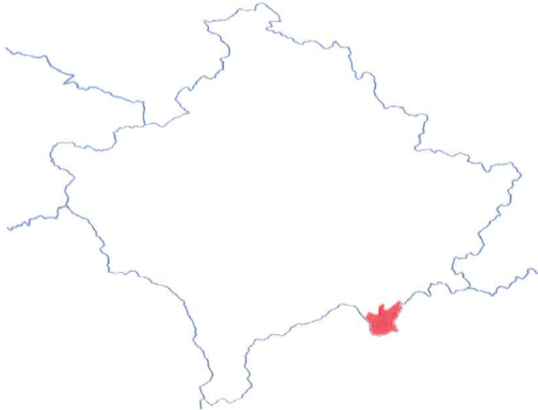
Figura 1: Pozita gjeografike e komunës së Hanit të Elezit

Komuna ka gjithsej 11 zona kadastrale, dy prej të cilave kanë qenë të shpopuluara që nga viti 1999. Sipas të dhënave të Agjencisë së Statistikave të Kosovës nga regjistrimi i popullsisë së vitit 2011, Komuna e Hanit të Elezit ka 9.403 banorë.